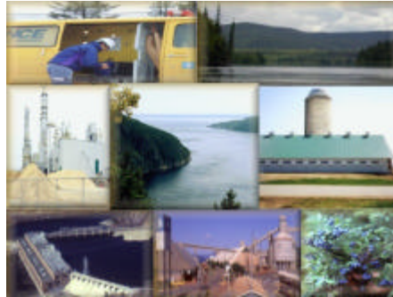
Le Saguenay-Lac-Saint-Jean a une mosaïque d'activités qui peuvent avoir des impacts environnementaux.

Qu'il s'agisse des secteurs industriel, municipal, agricole ou encore d'interventions concernant le milieu naturel, les activités de la Direction régionale gravitent essentiellement autour des trois pôles suivants :