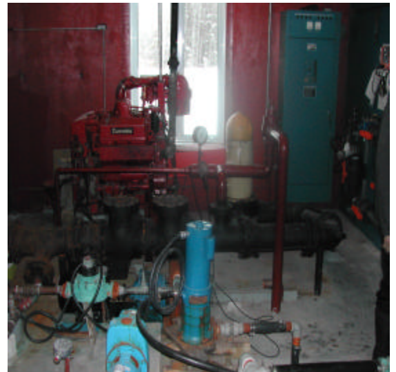
Les systèmes d'approvisionnement en eau potable, telles les stations de pompage, ont retenu toute notre attention au cours de la dernière année.

Par ailleurs, l'application du nouveau Règlement sur le captage de l'eau souterraine entraînera un besoin de support auprès de la clientèle afin de bien initier sa mise en œuvre.