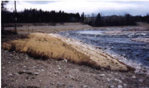
Le PSB est intervenu pour stabiliser des berges affectées par le Déluge

Les conclusions des suivis ont notamment engendré des correctifs à des ouvrages réalisés par le PSB depuis 1996. À cet effet, 19 travaux distincts ont été réalisés à l'automne, pour un coût total de 300 000 $ en immobilisations alors qu'un budget de 1 million était disponible. Pour le bon fonctionnement du