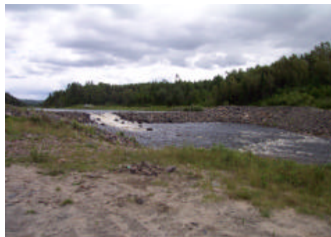
Le service de l'administration gère maintenant en région les transactions du Programme de stabilisation des berges initié suite au Déluge

L'équipe du Service de l'administration est impliquée dans le quotidien du personnel à tous les niveaux. Que l'on pense aux payes et à l'assiduité des employés, au recrutement, à la formation, aux paiements des factures, au suivi