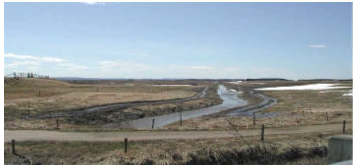
Les bonnes pratiques agro-environnementales ont un impact positif sur la qualité de nos cours d'eau. Les agriculteurs sont des acteurs importants pour la protection de l'environnement

De plus, nous voulons consacrer des efforts pour mettre en œuvre le nouveau cadre de gestion sur les pesticides, caractériser la rivière Ticouapé, collaborer à la mise en place d'un comité de bassin sur ce plan d'eau et renforcer les actions du ministère de l'Environnement au chapitre des pratiques agro-environnementales. Un bon programme en perspective !