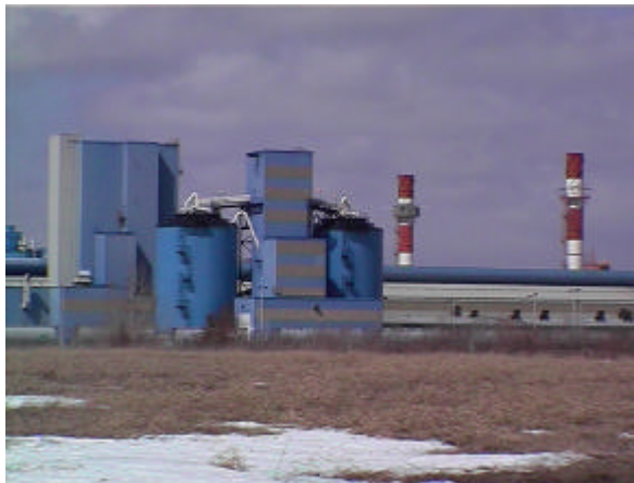
La présence de plusieurs grandes alumineries dans la région nécessite des programmes de contrôle efficaces

derniers mois, les vingt-cinq scieries dont la capacité de transformation est la plus élevée ont fait l'objet de contrôle en lien avec les lignes directrices sur l'industrie du bois de sciage. Dans plu-