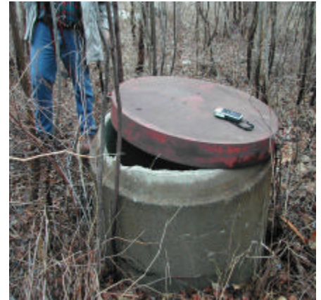
La question de la recherche d'une source d'approvisionnement en eau potable est revenue constamment dans l'actualité en 2002-2003

réalisé un travail d'acquisition de connaissances concernant la qualité de l'eau souterraine à proximité de bleuettières. Des partenaires gouvernementaux et municipaux ont été étroitement associés à la réalisation de ce mandat. La publication de l'étude est prévue à l'automne 2003.