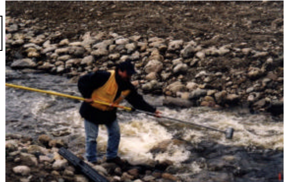
Des échantillonnages sont nécessaires pour effectuer un bon suivi sédimentaire des rivières ayant fait l'objet de travaux de stabilisation.

Ces stagiaires ont été reçus pendant des séjours de un jour à six mois afin de compléter leur formation académique ou pour s'initier aux différentes tâches des employés du ministère de l'Environnement.