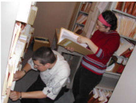
Nous avons reçus plusieurs stagiaires cette année

Vous pouvez consulter notre «Déclaration de services aux citoyens» sur le site Internet du Ministère ou à notre direction régionale.