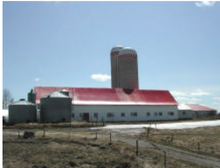
Le secteur agricole est important pour nous. C'est pourquoi nous avons complété la visite de toutes les fermes.

Ce règlement permettra, progressivement d'ici 2010, une relation optimale entre l'agriculture et le développement durable en ciblant davantage les productions animales, l'épandage de fumiers, la détermination de la capacité de support des sols, le suivi du phosphore et la protection des cours d'eau.