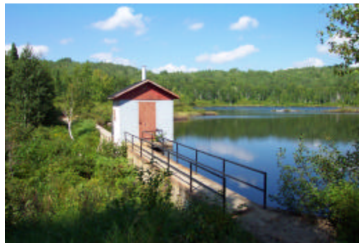
Le dossier de l'eau a été une priorité cette année, particulièrement pour les municipalités qui s'approvisionnent en eau de surface.

La Direction régionale du Saguenay-Lac-Saint-Jean garantit à sa clientèle des services de qualité conformes à la Déclaration de services aux citoyens du ministère de l'Environnement.