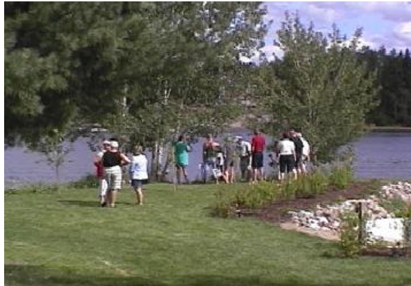
L'équipe du milieu naturel a organisé une Journée portes ouvertes sur le site d'un projet de démonstration de renaturation d'une bande riveraine au lac réservoir Kénogami

rentides et enfin, celui du prolongement de l'autoroute 70 vers La Baie.