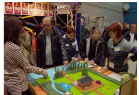
La maquette «Rives en jeux» est un outil d'éducation sur les aménagements riverains qui a été utilisée lors de notre présence à Expo-Nature 2002.

notamment, lors de rencontres avec divers groupes du milieu et par notre participation à une émission diffusée au canal Vox de Vidéotron.