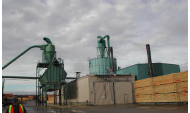
La transformation du bois en au cœur de l'activité économique régionale

Retrouvez-nous sur Internet au www.menv.gouv.qc.ca/regions/region_02