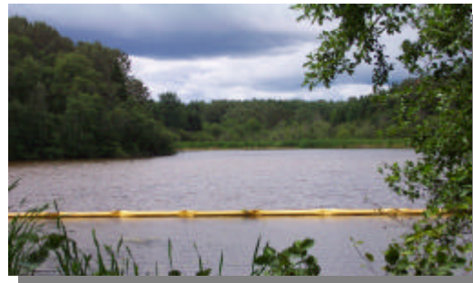
L'eau a été au centre des préoccupations des effectifs de la Direction régionale

La mission de la Direction régionale se traduit en action par des activités d'analyse, de contrôle, de prévention et des interventions lors de situations d'urgence qui risquent d'avoir un impact sur la qualité de l'environnement dans l'immédiat et dans l'avenir.