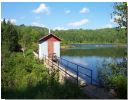
Plusieurs municipalités doivent revoir leurs sources d'approvisionnement en eau potable pour satisfaire au nouveau règlement

« Une amélioration de la qualité de l'eau et une sécurité accrue pour les citoyens »