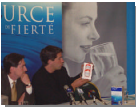
Le programme d'échantillonnage des puits individuels a été annoncé en primeur à Chicoutimi par le ministre M. André Boisclair accompagné pour l'occasion du député du comté M. Stéphane Bédard

« Une amélioration de la qualité de l'eau et une sécurité accrue pour les citoyens »