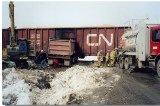
S'assurer de la récupération de carburant suite à un accident fait souvent partie du travail des 6 membres (en rotation) de l'équipe d'urgence

Le midi, le soir, la nuit, les fins de semaine et les jours fériés : en composant sans frais le : 1-866-694-5454.