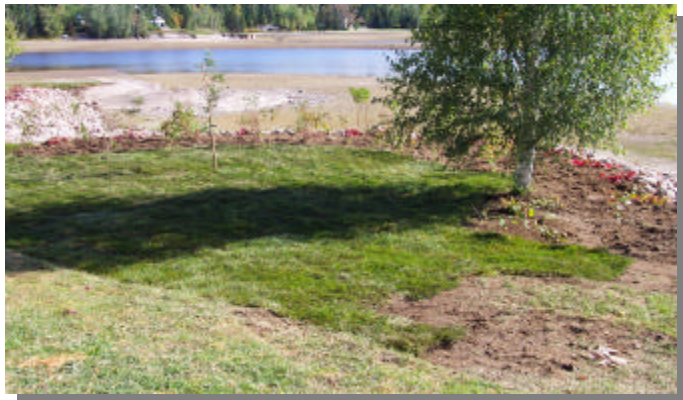
La renaturalisation des berges est un dossier qui a fait l'objet d'un projet de démonstration au lac Kénogami

Le milieu naturel est omniprésent dans la région. L'importance de son domaine hydrique, de ses ressources en eau, de ses lacs et de ses rivières ne fait pas de doute. L'équipe du secteur du milieu naturel est dédiée à cette ressource inestimable qui est à l'origine de la désignation de « Royaume du Saguenay - Lac-Saint-Jean ».