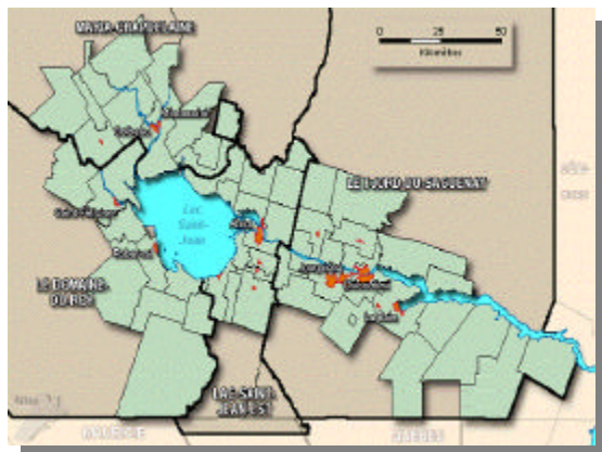
Son réseau hydrographique a façonné le Saguenay - Lac-Saint-Jean

« Assurer, dans une perspective de développement durable, la protection de l'environnement »