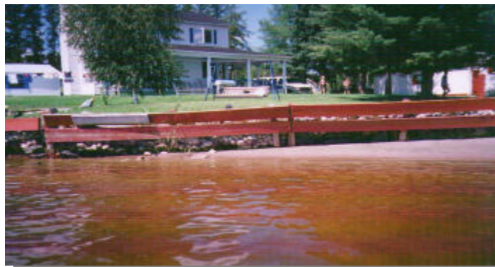
La dénaturalisation des rives fait partie des problématiques qui retiennent l'attention de la Direction régionale

Au cours de la prochaine année, la Direction régionale entend mettre l'accent sur la pêche blanche, la protection des rives, du littoral et des plaines inondables (information-éducation-sensibilisation), le programme de suivi du déluge de juillet 1996, la stratégie régionale des aires protégées, l'application du Règlement sur les normes d'intervention en milieu forestier et le plan de renaturalisation des rives du lac Saint-Jean.