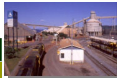
Le transport et le transbordement de matières premières au cœur de l'activité industrielle régionale

« Des inspections sont faites de façon systématique et à une fréquence définie selon les secteurs industriels »