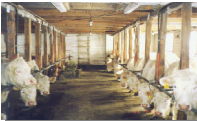
L'agriculture est un secteur important de l'économie régionale qui s'oriente de plus en plus vers le développement durable

L'équipe du secteur agricole de la Direction régionale a autorisé 165 projets de valorisation de matières résiduelles fertili-