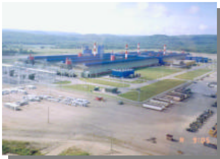
La région compte quatre alumineries

Le secteur industriel représente pour la Direction régionale une part importante de son équipe, tant au niveau de l'analyse que du contrôle.