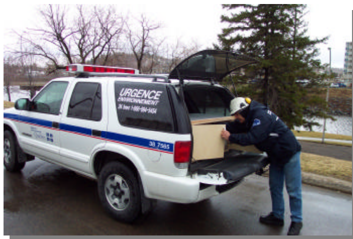
Cette année, la Direction régionale a fait l'acquisition d'un nouveau véhicule pour l'équipe d'urgence

Au cours de la prochaine année, un autre enquêteur viendra se joindre aux effectifs régionaux dans le cadre de la régionalisation des enquêtes.